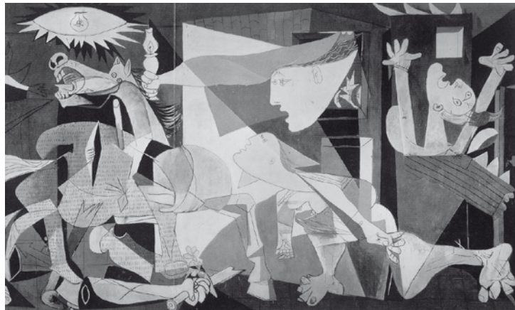
Detalle del cuadro del Gernika, de Pablo Picasso

Las administraciones públicas (entre ellas los Ayuntamientos) podrán retirar subvenciones y ayudas a aquellas instituciones o particulares que conserven los símbolos franquistas, que estarán obligados a retirar en virtud de la nueva redacción de la ley de Memoria Histórica. ■