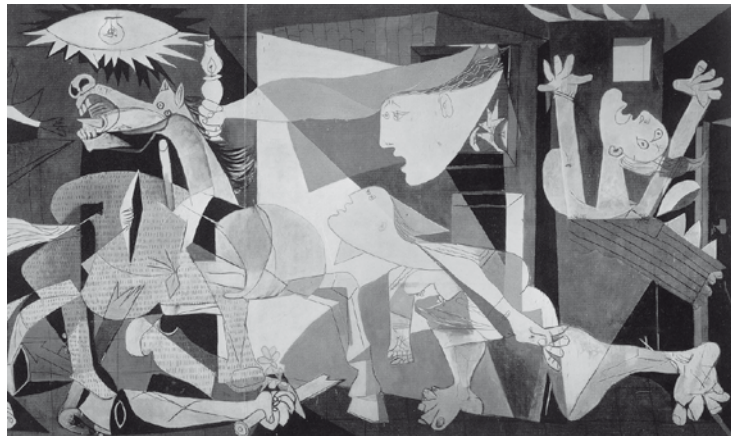
Detalle del cuadro del Gernika, de Pablo Picasso

Las administraciones públicas (entre ellas los Ayuntamientos) podrán retirar subvenciones y ayudas a aquellas instituciones o particulares que conserven los símbolos franquistas, que estarán obligados a retirar en virtud de la nueva redacción de la ley de Memoria Histórica. ■